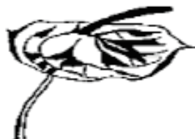
Flor pasada de corte

La maduración de la flor empieza a notarse en el espádice; su color intenso se mueve hacia adelante; este estado es visible en forma de pequeñas manchas, además el color del espádice cambia gradualmente de abajo hacia arriba; la flor usualmente puede ser cortada cuando el espádice tiene un 75% de este, (de igual manera un tip también es medir la parte verde o la punta del espádice con la falange distal de nuestro índice).