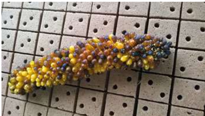
Semilla madura óptima para la siembra

campo 12 meses; la producción de flor para comercializar se demora aproximadamente 2 años. La siembra se realiza apretando la semilla y colocándola sobre turba, espuma agrícola, o palo podrido bien tamizado.