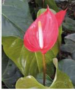
Forma cucharo o copa