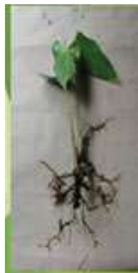
planta por división