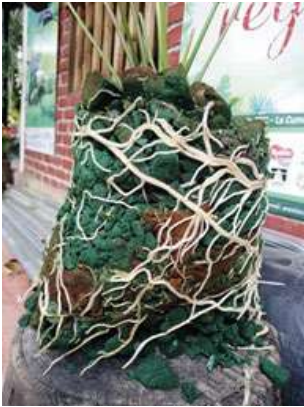
Sustrato inorgánico (oasis)

Siembra: el anturio se cultiva en camas o macetas; la distancia de siembra debe ser de 30 por 30 o 25 por 25 cm entre plantas a una superficie de 5 cm; las eras o camas generalmente son de 120 cm de ancho, caben alrededor de 16 plantas por metro cuadrado y se puede sembrar de una o dos plantas por sitio.