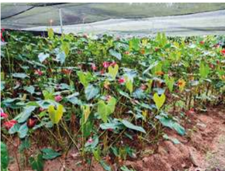
Cultivo de Anturio en cascarilla de arroz

Los vientos fuertes causan daños en hojas y flores y producen deshidratación.