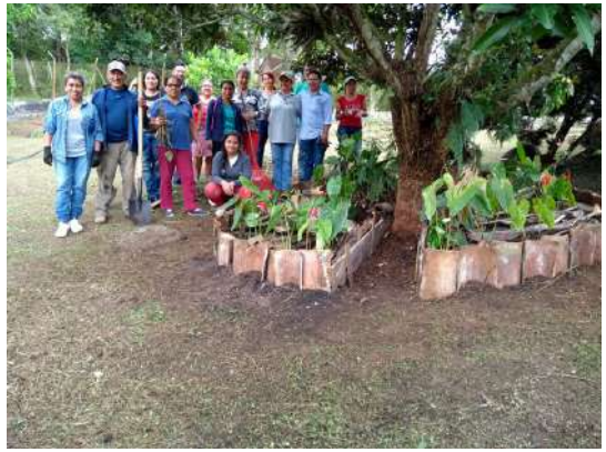
Construcción de era con material orgánico compostado

El riego: Los riegos deben ser diarios durante los meses más secos; en época de lluvia no debemos regar; el consumo aproximado es de 3 litros de agua por metro cuadrado al día teniendo un sistema de riego con microaspersor y dependiendo del tipo de sustrato. Se recomienda utilizar agua libre de procesos que no contengan cloro; el riego se debe aplicar entre las 6 y las 9 de la mañana y a partir de las 4 de la tarde para evitar el choque térmico y el daño en las hojas y flores. El sustrato de siembra debe estar húmedo mas no empapado.