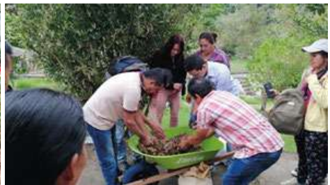
Preparación de abonos orgánicos