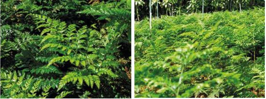
Rumohra adiantiformis (helecho cuero)

Los follajes (hojas) son parte fundamental de un bouquet floral, pues son el complemento ideal al momento de realizar este tipo de arreglos; aproximadamente el 60% de un arreglo floral son follajes, permitiendo exaltar la belleza y diversidad de colores de las flores. Existen en diferentes tamaños y colores.