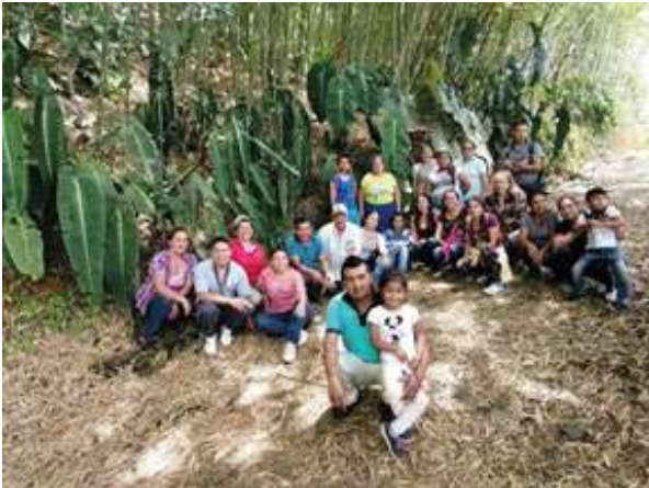
Participantes en el taller de capacitación anturios-follaje