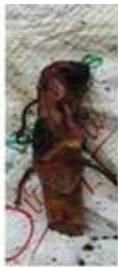
Esqueje por multiplicación asexual

Por división cuando han brotado raíces aéreas, se pueden separar los hijos o brotes de las plantas madres.