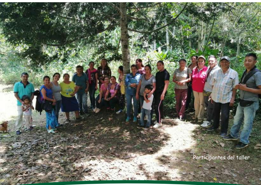
Participantes del taller