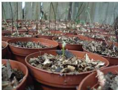
Propagación de Helecho cuero