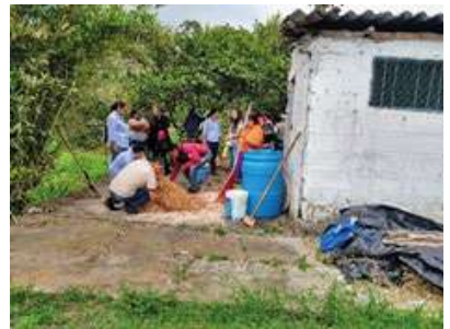
Preparación de sustrato