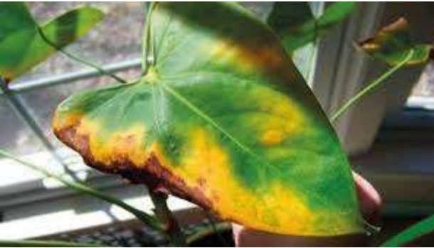
Planta con fusarium

Existen diversas especies de fusarium. Sin embargo, los anturios se ven afectados por los que causan enfermedades de cáncer de tallo, pudrición de raíz o marchitamiento vascular. El fusarium habita en el suelo en forma de esporas y se propaga fácilmente a través del agua y herramientas infectadas. Al encontrar una planta con características de enfermedad de fusarium se recomienda retirarla inmediatamente del cultivo.