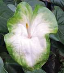
Forma de pera

Alas, cucharo, corazón, triangular, copa y pera.