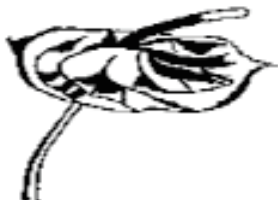
Punto de corte óptimo