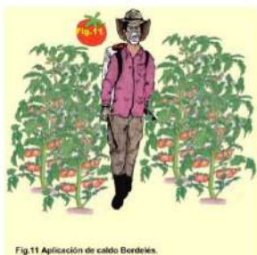
Fig.11 Aplicación de caldo Bordelés.

La aplicación debe efectuarse poco tiempo después de haber realizado el preparado; como "máximo debe usarse un día después".